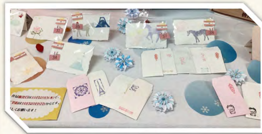
クラフトサークル