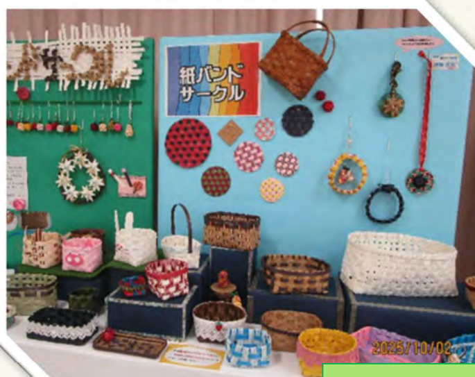
紙バンドサークル