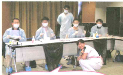
実際に防護具をつけ、体験しました！