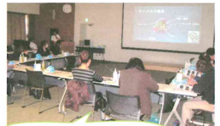
感染症の詳しい知識を学びました。