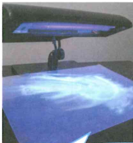
模擬の吐物（蛍光塗料）を処理してチェック！ 拭き方はどうすればいいでしょうか…？